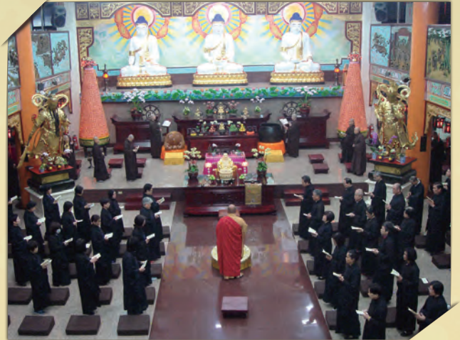
▲ 明靄法師帶領大眾一同持名念佛