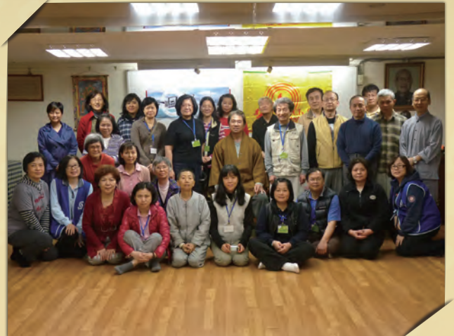
▲ 活動圓滿後留下珍貴的大合照