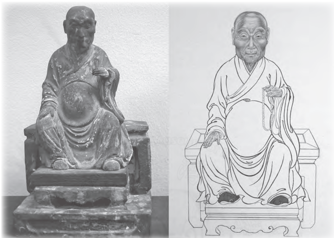
圖三：樹壁和尚塑像及畫像對照