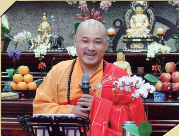
▲ 明靄法師為大眾開示念佛的意義與功德