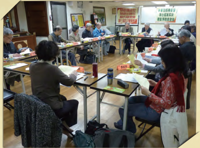
▲ 董理監事們專注聽取會務報告