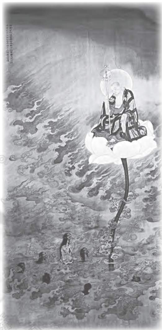
圖一：劉建志繪地藏本願經變相