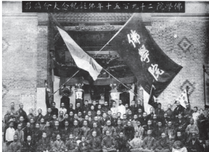
太虛大師親創的武昌佛學院，自1922年創辦，至今已近百年的滄桑歷史。

幼年星雲不曾上過學校，他曾說：「我不但日食三餐都很困難，也沒有錢讀書，連學校都沒有看過。」 20 又說：「十二歲出家以前，曾斷斷續續到私塾上過二、三次的課，但每天要繳四個銅板，四個銅板就可買二個燒餅，常常為了省錢，就不去上學。」 21 民國19年生，同樣是江蘇省籍的聖嚴法師（1930-2009）也是自幼失學，他表示：