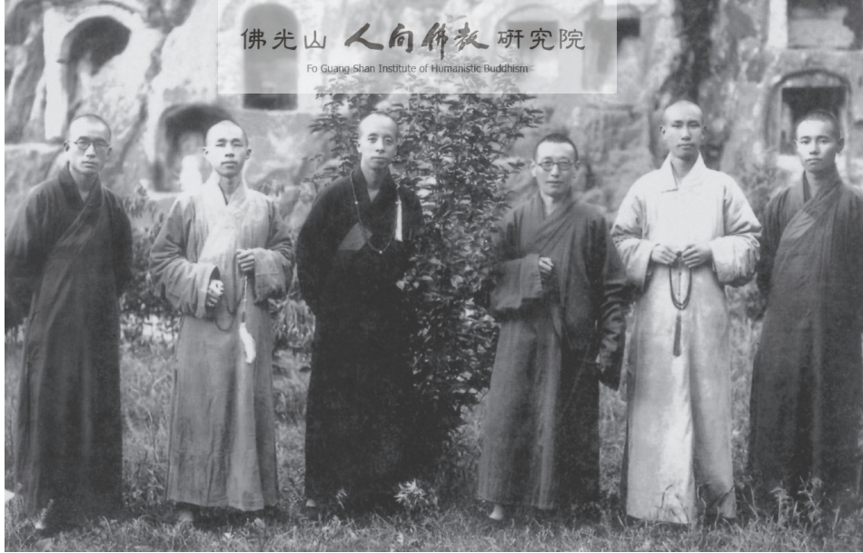
星雲大師於棲霞山親近之師長，左二為其師父志開上人。