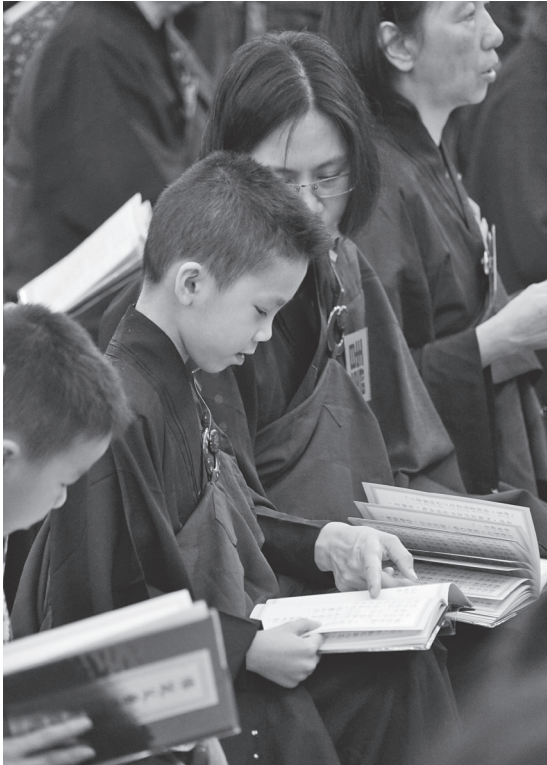
親子同受戒，家庭更祥和。

犯對方的生命、名譽、財產，更進一步的彼此愛護對方的生命、名譽、財產，這不就是人間淨土了嗎？