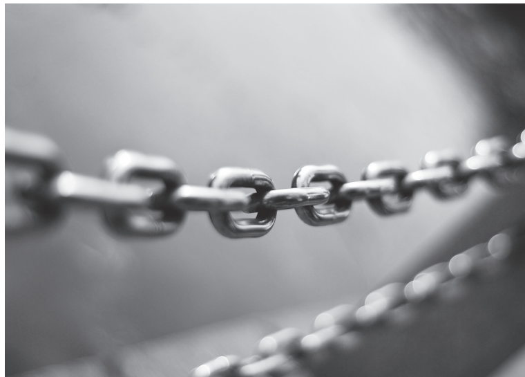
因果關係如同鍊條，環環相扣，互為影響。

我們如何流轉於法界之中？大家耳熟能詳的「欲知前世因，今生受者是」，說明我們現在所發生的善報或惡