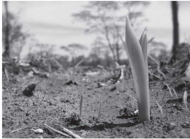
因果業報的顯現，與植物的成長一樣，由於條件因緣不同，而有遲速快慢之別。

有人問趙州禪師：「如何開悟？」趙州不但不回答，反而撇撇嘴走開：「我要小便去了！」走了幾步又回頭說：「你看這點小事都要我自己去，誰也代替不了。」各人吃飯各人飽，各人生死各人了，在因果的法則裡，修行也好，功成名就也罷，每一個人都要「做自己的貴人」。