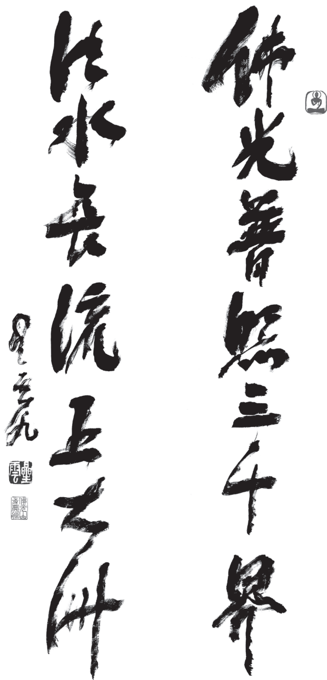
星雲大師一筆字書法〈佛光普照三千界 法水長流五大洲〉