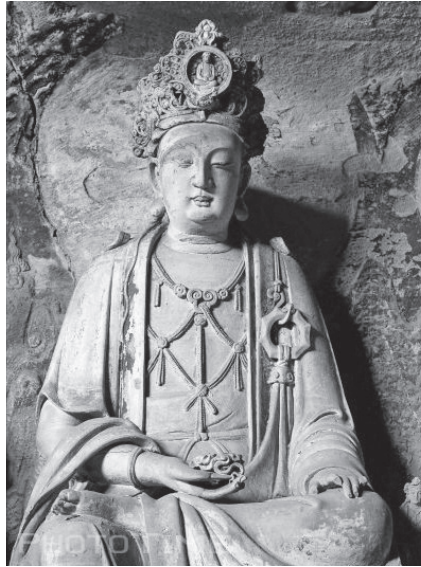
四川安岳華嚴洞彌勒菩薩

國淨土之成立，須具足清淨的「菩薩功德」、「眾生」、「眾生功德」三大因緣， 86 而菩薩道仰仗多生累劫的願行，且非一人、一時所能成就，需要許多菩薩行者長時努力、共同攝化。然而，大眾各有因緣業力，輪迴再世未必悉為人身，從長遠眼光來看，「往生佛國淨土」與「建設人間淨土」實則殊途同歸，誠如洪緣音所說：