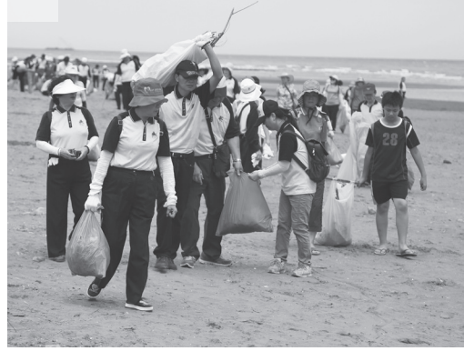
佛光人關心社會、關心地球，努力建設人間淨土。圖為國際佛光會中華總會桃竹苗區「千人千手做環保」淨灘活動，近 1500 人共襄盛舉。