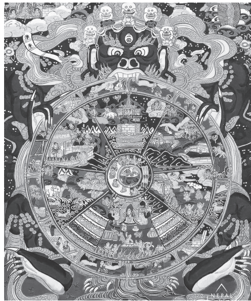
尼泊爾五趣生死輪圖（六道輪迴圖）

諸佛咸以「人身」、「人數」 35 示現八相成道，講經說法以人為重，源於閻浮提（南瞻部洲）的人道眾生具「勇猛強記、能造業行、能修梵行」的特質，亦憑此三事勝於餓鬼、龍、金翅鳥、阿修羅、四天王天、忉利天、焰摩天、兜率天、化自在天及他化自在天之有情， 36 顯示南瞻部洲的人道眾生具修持佛法的優勢。佛陀雖由「人身」而證成，教化諸多「人道」眾生，若視佛陀僅教化「人道」眾生，顯然不符合諸佛菩薩濟度五趣六道眾生的深心大願。