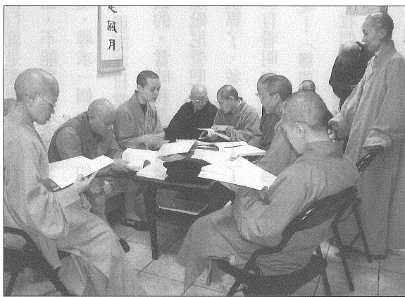
◎來自香港的學員於下課後自動集合，由一位熟悉普通話的法師以廣東話複講，共同複習當天上課的內容。