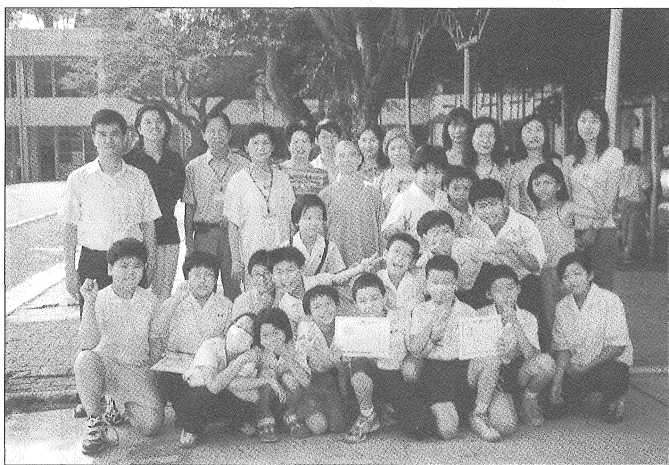
◎一群步佛足跡的志工們，願做小朋友們生命的朋友，為人間播下慈悲 智慧的希望種子