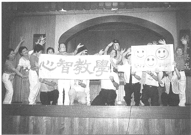
◎活活潑潑展演佛法的生機。心智教學，喔—YA！

從輔育院到國小心智教學的弘化，我們一直深信著，每個人都有被教育的可能，只要提供良善的因緣，啟發他的自覺，在心智上做更深層的修鍊，青少年們便能夠與社會間形成良性循環，開拓出生命的覺路。