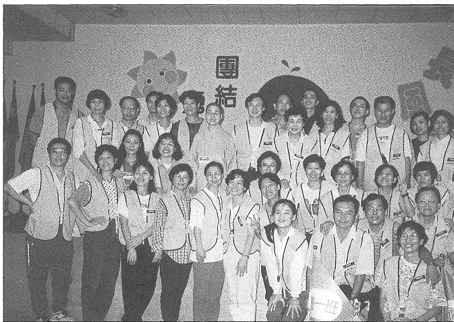
◎歡喜快樂的紫竹林精舍青少年弘化志工團。

學、團康駐站遊戲等，巧妙方便地將佛法融入活動中。民國八十八年，因院方改制與遷移，志工團亦重新檢視應從「治療不如預防」的教育方向，決定轉換跑道，選擇進入國小校園