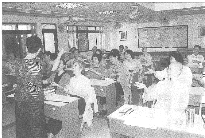
◎志工老師們參與「教學技巧與班級經營講座」，不斷地充實各項教學知能。

定學單元的教學主題是「靜坐與身心調理」。要調攝身心，從靜坐的基本功夫開始學起，而這對蹦蹦跳跳的同學來說，是比較枯燥，需要相當長的時間慢慢引導。所以，因應同學的學習狀況，本單元的教學設計強調：一、盡量以故事或活動取代說教。二、延伸教學：請同學回家練習