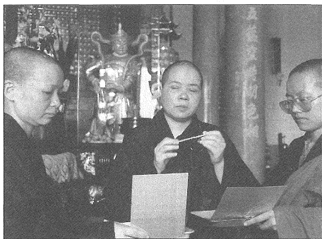
◎如何掌握佛法的精神，讓現代僧伽的生活能夠如法如律，是現代僧人的關心點。

由於香光尼僧團高教育水準的特質，對於僧伽的生活或僧伽的歷史與現實有著深刻的反省，亟思探討佛教傳入中國之後，中國的比丘、比丘尼的實際生活方式，有怎麼樣具體的改變。「佛入中國，則中國之。」這種中國化的佛教生活，在食衣住行等方面具有怎麼樣的改變？《香光莊嚴》作了很好的分析與報導。舉例來說，原始佛教主張僧人外出托鉢乞食，但在中國乞討是卑賤的行為，所以唐朝馬祖大師創建叢林，百丈禪師立下清規，中國僧伽開始進入「晝而農，夜而禪」自耕自食的農禪生活，進一步又