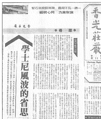
◎《香光莊嚴》11期中刊載「學士尼風波的省思」一文。

這七年間作了不少摸索，舉例來說，裡面有對於女大學生出家的事情進行深刻的反省，這是在第十一期裡的很重要內容。香光尼僧團對於民國七十六年七、八月間聯合報與時報週刊討論「學士尼」風波的問題，提供了客觀的討論與分析，其中強調佛教是理性的宗教，其理論與實踐皆自成一套科學的體系。因此，香光尼僧團在宏揚佛法的立場上，一直秉持著「人成即佛成」的理念，用理性的教學來自我學習和領導信眾，他們強調這中間沒有什麼神秘可言，如果一些受過高等教育的女生出家，更可以發揮宗教對社會的貢獻，要擔任社會大眾心靈導師的角色，更能夠發揮其功能。