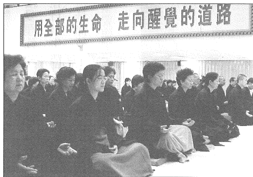
◎透過自身信仰的踐行而讓信仰與生活相呼應。

有一個重要的專欄是「生活」，裡面多是法師與居士們宗教信仰與日常生活體驗的現身說法，是信仰者在日常生活實踐的具體見證。這部分雖然常常以小品文出現，但實際上來說，我們常常可以在這些生活小品的閱讀中，體會到這些法師與居士們的佛教信仰與日常生活實踐之間的有機整合的關係。一種信仰必須要加以實踐，此信仰才有其具體的意義，而且這個信仰，需要充分的現代知識加以配合，換句話說，信仰除了不能是盲信之外，而且不是為信仰而信仰，相反地，信仰是建立內心的根