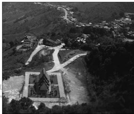
◎美斯樂是一個山城，與世無爭，戰後一批中國軍就在這裡生根。

飯後到佛塔參觀，園區草坪如茵，清風拂面，十分怡人。因著這寧靜，我在松樹下展鋪坐具，躺下來歇息。📍