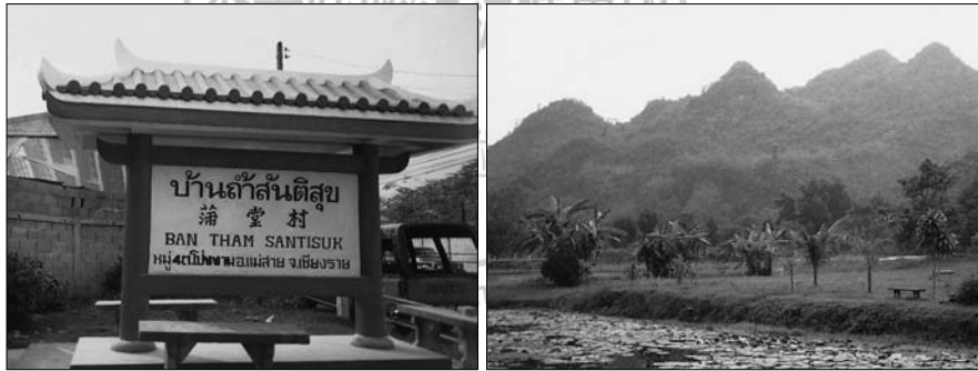
◎圖左：清萊的滿堂村，住的全是中國人。圖右：位於清萊府的中國城—滿堂村，山水相映成趣，如詩如畫。

飯後到湖邊散步，不知不覺登上猴子山。因周邊剛好沒人，遭到猴子攻擊、搶我的相機，還抓住我的背包要找香蕉吃，嚇得我大叫：「阿彌陀佛！」結果，猴群被我的叫聲（還是阿彌陀佛的力量？）喝住，很快跳逃散去。