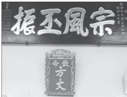
◎極樂寺內懸掛光緒皇帝欽命妙蓮禪師為極樂寺方丈匾額。

尺的觀世音菩薩聖像，是目前世界最高的觀音聖像。聖像，自極樂寺第四任方丈白聖長老便開始興建，至2002年開光，為中國菩薩立像式，面相慈祥，姿態自在安然，矗立在依山而建的平台。巍巍聳立的佛教新地標，令淄素二眾無不生起敬仰歡躍的心。我知道這趟馬來西亞行程趕個早，極樂寺被安排為首站，原因即如悟師父所說：「我們來頂禮白公老人曾駐錫之處。」