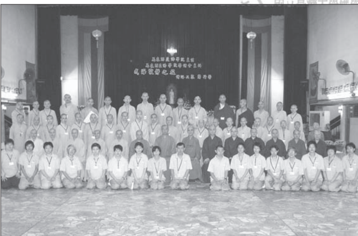
◎戒海寂靜之旅旅途愉快，留下大合照與豐富的回憶。

悟師父的開示，廣開戒律中的人情、法義，及悲憫世間的多重角度，學員們聽了反應相當受用，「為用而學」：戒律不再是死板板的戒條，嚴苛不近人情，而是在持守戒律的過程中，親切地在你我身心中體會解脫的真義。有學員表達這趟戒海寂靜之旅旅遊愉快，還有學員描述他聽得「耳油都流出來了」，呵，著實不知這樣的描述在馬來西亞所指為何，但可以確定的是大眾都收穫良多，這也是我們這次來馬來西亞最令人欣喜的部分。