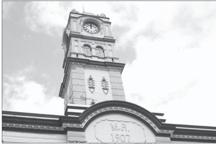
◎馬來西亞曾是英國的殖民地，第二大城——檳城的建築，還保留著當年殖民地時期的風貌。