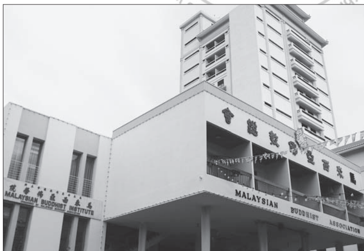
◎馬來西亞佛學院隸屬於馬來西亞佛教總會，在大馬推廣佛陀的教育。

一夜安眠，清晨五點多時，聽到遠方傳來唱誦的聲音，是透過喇叭播送的，心裡納悶著。後來才得知，那是回教的唱誦。他們一天五次祈禱，都會透過音響對外大放送，大家一起聆聽。這又讓我對於一個宗教被列為「國教」，在推廣上所能有的便利，有了更多的認識。