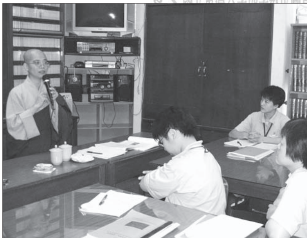
◎青年佛子前仆後繼，向十方撒播佛法清淨智慧的種子，承續著法的傳衍。（本刊資料照片）

行走在檳城，第一印象是高大的綠樹矗立在潔淨的道路旁，建築物間有著各種清涼、調和的色澤，濱臨的海岸線很長，相當寧靜、祥和，配上曲線優美的檳威大橋，好個令人舒服的城市！心想起，一千六百年前法顯大師到印度取經，回航經海線時，曾佇留馬來西亞島嶼間傳播佛法……。民國以來，圓瑛和尚、虛雲和尚、白聖長老、慈航法師、竺摩法師、芳蓮法師等，也都曾經為了佛法，漂洋過海，來到此地。還有許許多多僧人，前仆後繼地，走在馬來西亞的弘法路上，就在這個儒、伊、佛、民間信仰生活多元，以伊斯蘭教為國教的文化之下，他們播撒漢傳大乘佛法種子，多少歲月的蕞路藍縷，血汗耕耘，想是唯有佛菩薩全知之！見之！