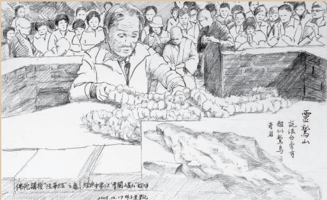
◎圖片文字：靈鷲山／說法台旁有酷似鷲鳥奇岩／佛陀講授法華經之處 經典中常以耆闍崛山稱呼（繪圖：林玉葉）