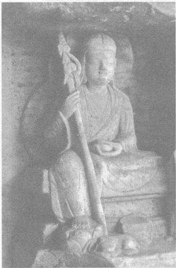
■ 大足石窟佛灣第279號龕地藏像 (五代後蜀所造)

其三，〈閻浮眾生業感品〉所載，地藏菩薩於過去久遠劫前，為一國王，其國內人民多造惡業，