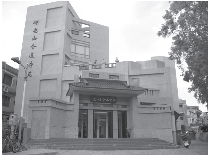
佛光山金蓮淨苑外觀

也就是念佛會最初的發起人魯賢成居士。出家後在民國54年（1965）10月於苗栗「法雲寺」乞授三壇大戒後，正式受聘為金蓮淨苑的負責人及導師。自此「金蓮弘開」信眾景從，皈依念佛風氣特盛，為弘揚大乘法，引導大眾邁向淨土嶄新里程。民國57年（1968）11月15日，當時國防部長蔣經國先生蒞臨金門時，曾專程詣金蓮淨苑關懷垂詢，有感於此地蓮友自助建寺之精神，深深讚歎宗教情操之不可思議！