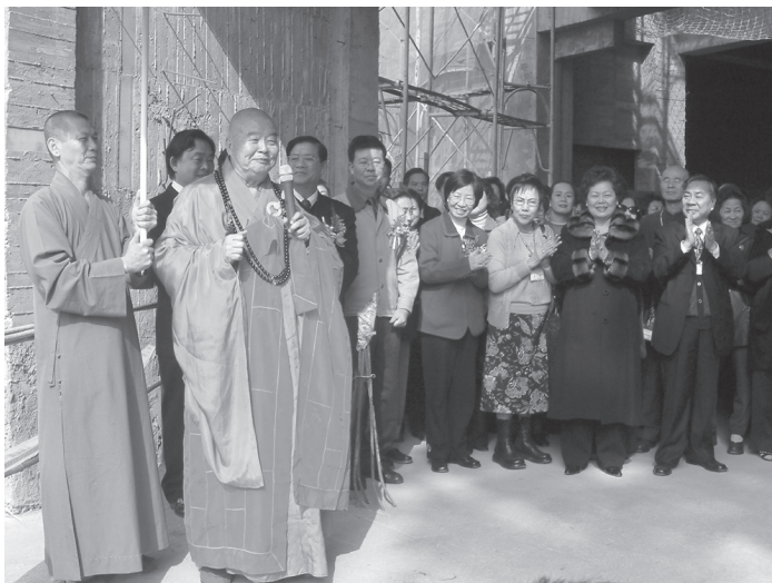
2005年1月27日，星雲大師主持金蓮淨苑殿樑安置法會