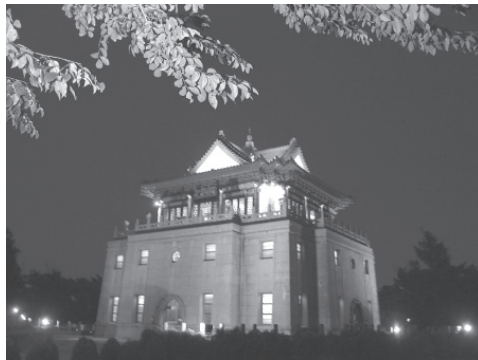
金門地標莒光樓之夜景

金門舊名浯洲，又名仙洲、浯江、滄浯等。明洪武 20 年（1387）江夏侯周德興築千戶所鞏固海防，禦寇防盜，以金門城之地理形勢（固若金湯，雄鎮海門）因名金門。金門雖只是閩南沿海一座小島，卻具有其獨特的地理位置和歷史淵源。唐·陳淵牧馬闢草莽，化荒墟為樂土；宋·朱熹辦學教化，而有「海濱鄒魯」之美譽；明顯文治、清耀武功，文官武將，史冊不絕，在歷史洪流的關鍵時刻，更屢屢突顯其特有的重要地位。本世紀初，金門僑民大量移徙遷徙東南亞，成了閩南僑鄉之一。國共內戰，兩岸對峙，使今日的金門，成為匯集閩南、戰地及僑鄉三種特色於一體的文化區域。