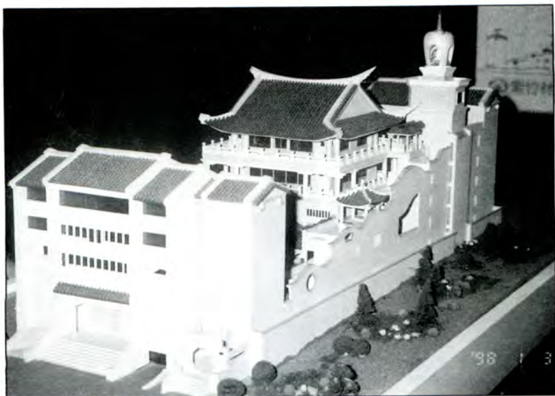
■高雄鳳山紫竹林精舍建築模型

佛教入華後，這些不同形式的佛教建築，也相繼進入東土，由於中國的風土人情不同於中亞、印度，因此，佛教逐步華化。而華化後的佛教建築由石窟演變為木造殿堂或僧房，亦即佛寺。佛塔也有密檐塔、樓閣塔、喇嘛塔、金剛寶座塔等不同形式。其中，佛寺尤其成為佛教建築的主流，影響及於韓國、日本，且遍及中國江南、閩粵。佛寺的群組布局、殿宇的外形結構、屋頂、樑柱、藻井、壁間、窗門等的各項裝飾等，在長時期歲月的累積下，已和中國本土的儒、道思想相結合，而形成一完整的中國佛教建築風格。 自十七世紀以下，漢文化逐漸東渡臺灣，中國佛教建築中的閩南式樣，也隨著閩粵移民的佛教信仰而入臺。