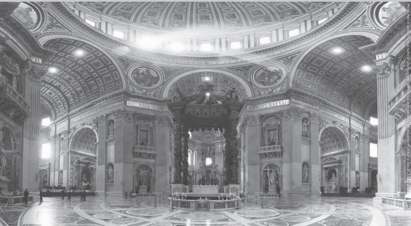
聖彼得大教堂大殿內部景觀，其中祭壇位於中央

像與雕塑富有高超的藝術造詣，不禁令人驚歎宗教的力量。但是，優師因身體不適，即使面對再美的景物，終究要放棄欣賞，只能在教堂的角落休息。