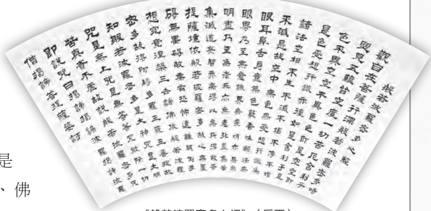
《般若波羅蜜多心經》（扇面）