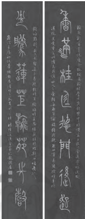
圖五：〈黃金篆書對聯〉

除了寫經，寫古人的詩句之外，也有自創的聯語，如篆書對聯曰：「禪心朗照千江月，真性清涵萬里天。」(圖四)又如黃金篆書對聯：「香滿桂庭德門後起，光騰蓮炬翰苑先聲」。