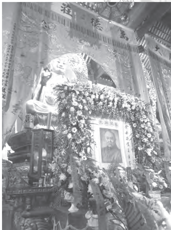
大雄寶殿內主尊前為紀念應慈法師法會的供桌