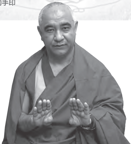
圖1：無上瑜伽部供養法的「供塗香手印」