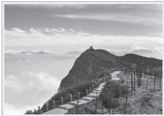
峨眉山最高峰海拔3099公尺的萬佛頂

佛教最早於何時傳入峨眉山？根據南朝梁時期僧人慧皎所編的《高僧傳》記載，東晉時僧人慧持，聽聞成都地沃民豐，立志前往傳法，並踏訪峨眉山、岷