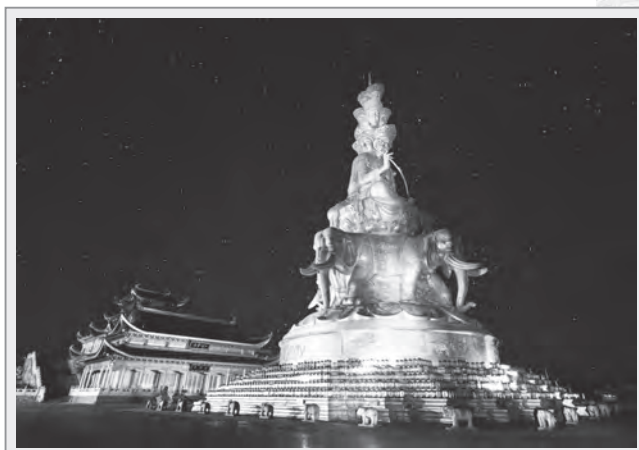
峨眉金頂夜景與十方普賢菩薩像（建於2006年）

其他寺廟，尚有矗立於大峨山頂峰的華藏寺（古稱光相寺）、峨眉山現存建築群規模最大的伏虎寺、景緻優美的洪椿坪、洗象池等等。