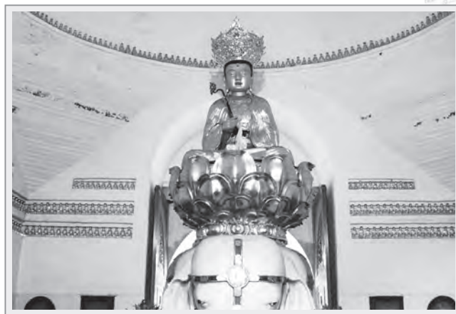
萬年寺內供奉的宋代普賢騎象銅像