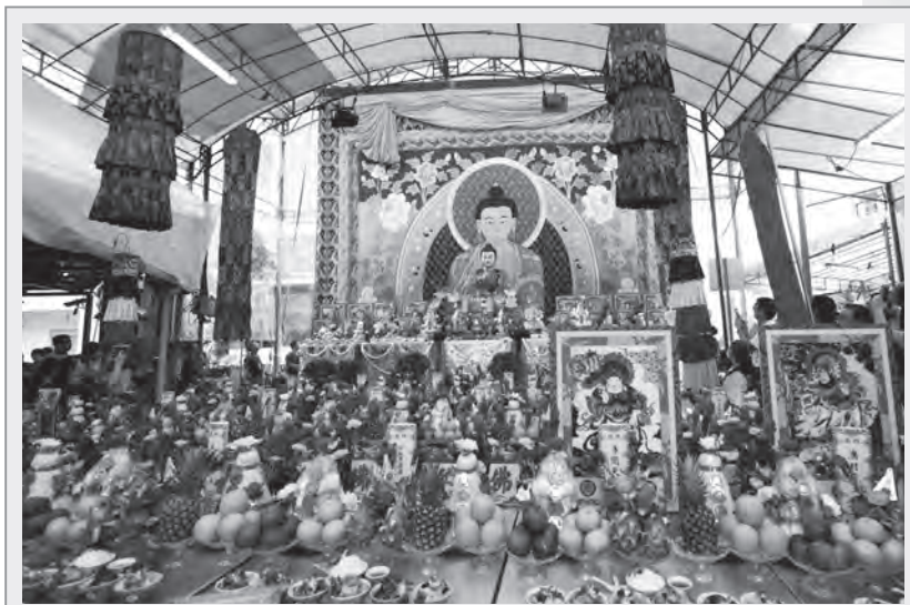
於新加坡舉行的一場薩嘎達瓦法會

一般來說，西藏在傳統的薩嘎達瓦節期間，寺院都會從事相關佛事活動，藏人們則會作禮佛、點燈、布施、供養、茹素、不殺生、持咒、繞塔、懺悔、轉經輪、大禮拜、朝聖等善行，有些人甚至會閉關修持。因此，薩嘎達瓦節時，可說是藏人一年中最重要的節日！