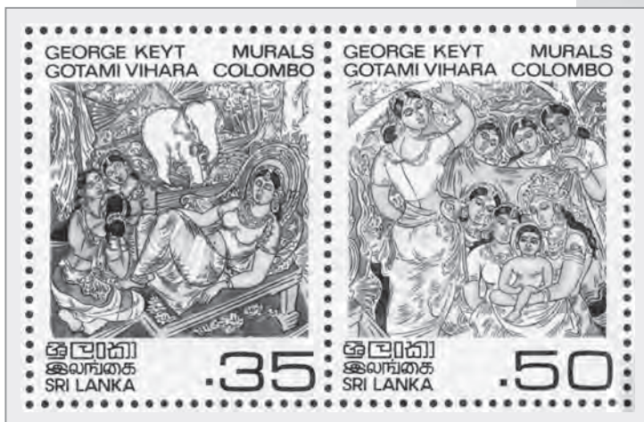
斯里蘭卡於1983年5月13日發行的衛塞節紀念郵票（局部）

衛塞節這一天（有時數天），是佛教徒最重要的節日，如泰國、斯里蘭卡等國家，甚至將這一日訂為國定假日。此時，各地會舉辦浴佛、供佛、瞻仰佛陀舍利、獻燈、放生、茹素、佛法開示、誦經、音樂會、義賣會、旅遊、頒獎典禮、素食烹飪比賽，以及各