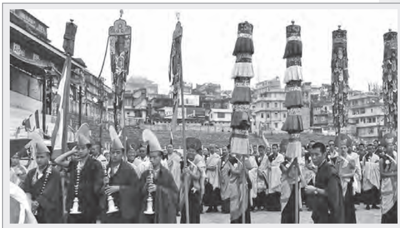
藏傳僧眾正在進行法會儀式

總之，佛誕節由於佛教傳播至各地而有不同的風貌呈現，其中浴佛典禮，以南傳和漢傳佛教舉行為最多，而藏傳佛教則是以一個月的行善修行為主，並將藏曆4月15日訂為最殊勝日。然而，不論信徒以何種方式舉辦佛誕節，憶佛恩德、感謝佛陀之心都是相同的。☉