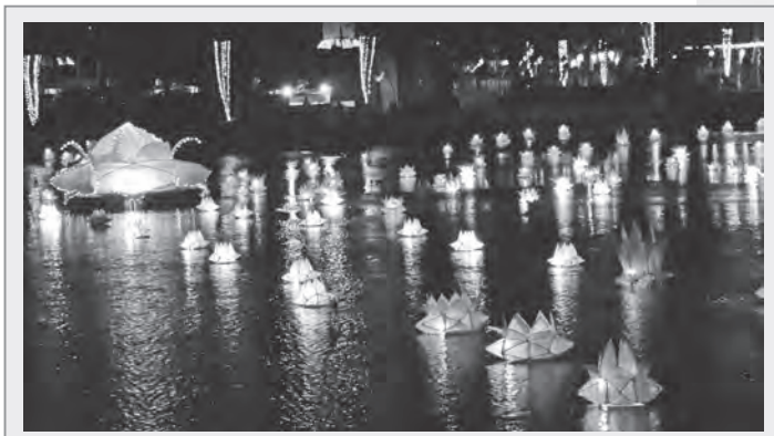
斯里蘭卡衛塞節夜間放水燈