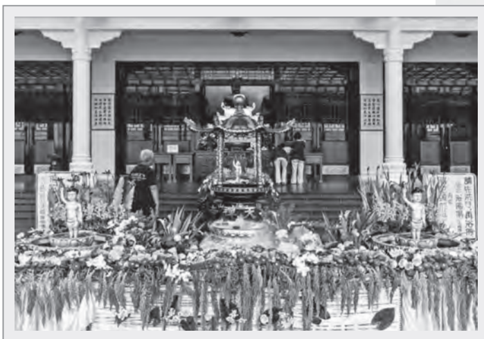
土城承天禪寺浴佛活動