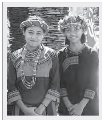
排灣族原住民少女傳統頭飾和服飾

各族會有不同的獨特風格，如泰雅族喜縫上貝珠；排灣族的服飾偏暗色系，但結婚禮服會布滿圖案，縫上許多美麗的珠子，而頭飾在排灣族中非常重要，也是族人裝飾的重點。