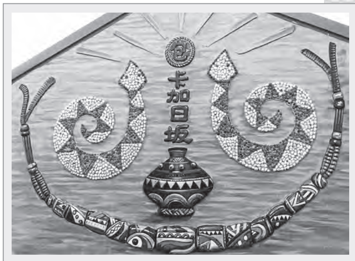
排灣族的圖騰是百步蛇

例如，「五年祭」為排灣族重要的傳統祭典，又稱「人神盟約祭」、「竹竿祭」。儀式中主要是請神降臨人間接受獻祭和祈福等，也有凝聚家族向心力、共同祭祀祖先的含義，這是全部落的人都要共同參加的活動。