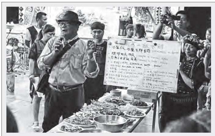
排灣族土坂部落小米收穫祭晚會中的傳統風味餐競賽