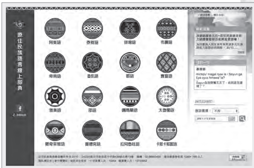
原住民族委員會設置的「原住民族語言線上詞典」，網站中收錄了各族耆老、各族族語老師所錄製的族語 ( http://e-dictionary.apc.gov.tw/ )

或稱台灣南島語，共有20餘種，可歸納為「泰雅語群」、「排灣語群」和「鄒語群」三大類。