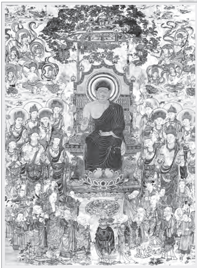
8世紀刺繡《佛陀說法圖》，現收藏於日本奈良國立博物館

佛教起源於西元前六世紀，釋迦牟尼佛誕生於古印度恆河流域的迦毗羅衛國，俗名「悉達多·喬達摩」。29歲出家，歷經六年苦行，35歲獲證無上正等正覺，涅槃前轉妙法輪說法度眾四十餘載，後人將佛陀說法的內容分為經藏與律藏。「經藏」又名為「修多羅藏」、「素怛纜藏」，是為上契諸佛之理，下契眾生之機，貫穿諸法深義；「律藏」又稱「毗奈耶」，被認為是僧伽的依怙，其內容包含佛教戒律之規定與討論，當中講述制定戒律的最初起源與意義、各項戒條名稱與開遮持犯。