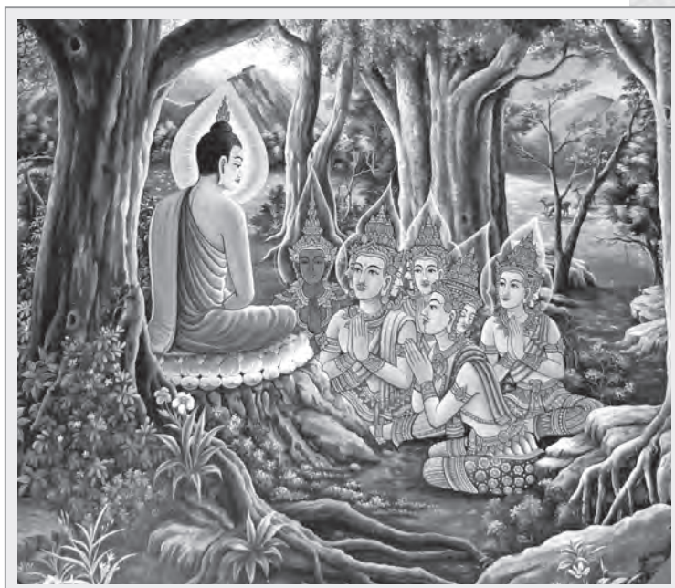
傳統泰國繪畫風格的《佛陀說法圖》

而佛陀在還沒有制戒以前，弟子們是依照什麼標準行持？在佛陀成道後的12年間，僅以一句偈頌做為行持標準，即「諸惡莫作，眾善奉行，自淨其意，是諸佛教。」（註1）在佛陀成道之初，弟子們心意清淨，毋須制定細則就能如法修行獲證聖果，所以僅用一個偈頌囊括所有的戒律。