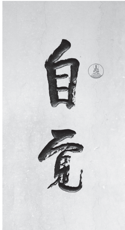
星雲大師一筆字《自覺》

「自覺」是什麼呢？就是自我覺悟，首先要效法「善知識」與人為善、樂說無礙、契理契機、慈悲喜捨等美德，更要勇於承擔，靠自己努力學習，才有辦法覺悟。能夠自我覺悟，就是自我管理，管理自己的身口意，譬如要肯讚歎布施、懂得謙卑和睦、凡事反求諸己、能夠給人接受、不道聽塗說、不譏諷毀謗等。時時自我覺悟、自我管理，當身口意三業清淨時，才能開展智慧，自我提升，進一步落實「行佛所行」。