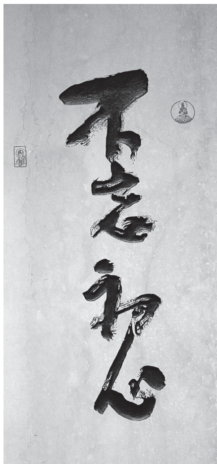
星雲大師一筆字《不忘初心》

「不忘初心」，也讓我得到許多難遭難遇的助緣，例如：我不懂建築，只憑著為佛教培養人才的信念，就有多少因緣護持，成就了佛光山的開山；我沒有讀過書，但知道教育的重要，也明白個人的力量有限，發起了「百萬人興學活動」，讓智慧留在人間；我不會外文，但生起了「要將法水長流五大洲」的心願，再加上各地有心人士的護持，從此走上國際弘法的道路；我的五音不全，梵唄唱誦不行，但為了以音樂弘揚佛法，組織「佛光山梵唄讚頌團」，