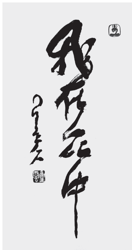
星雲大師一筆字《我在眾中》