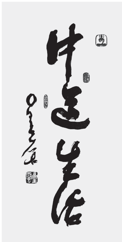
星雲大師一筆字《中道生活》

如此，「我在眾中」，雖然未嘗不是「佛在眾中」，但更重要的場景卻是「我在佛中」。仔細掂量大師的話語，實在能夠產生很